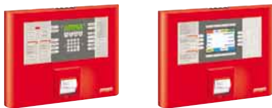
Externý ovládací panel s tlačiarňou: 360 x 445 x 45 mm (V x Š x H)

Prípustná teplota okolia: 0-40° C Farba: červená RAL 3000