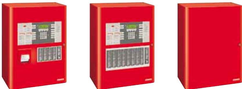
SLZ/BLZ Integral skriňa: 600 x 445 x 225 mm (V x Š x H)