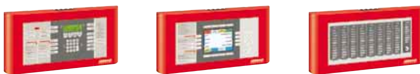
Externý ovládací panel: 230 x 445 x 35 mm (V x Š x H)